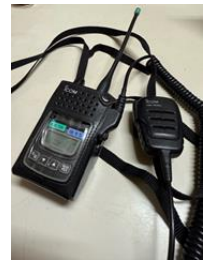
<CR無線機> 隊員は一人一台、必ず携帯する

主な仕事は、通信室に待機して無線の“番”をすることです。現在南極では、建物周辺ではインターネットがつながりますが、脆弱です。電話もつながらないため、隊員は連絡用に、1日中無線機を持ち歩く必要があります。特に隊員が遠くの野外に出るときや、海氷上で作業するときは、必ず連絡を取り合って無事を確認します。夏は昭和基地に人が多く、だれがどこに行くのか把握するのが大変です! 越冬中は引き続き隊員の動向を把握や機器のメンテナンス、日本から衛星電話の着信があったときの取次をします。この仕事は隊員の命をつなぐ大事な役割です。責任が重大ですが、その分やりがいを感じています。