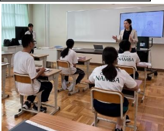
マインドマップ作成