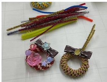
ハンドメイド制作